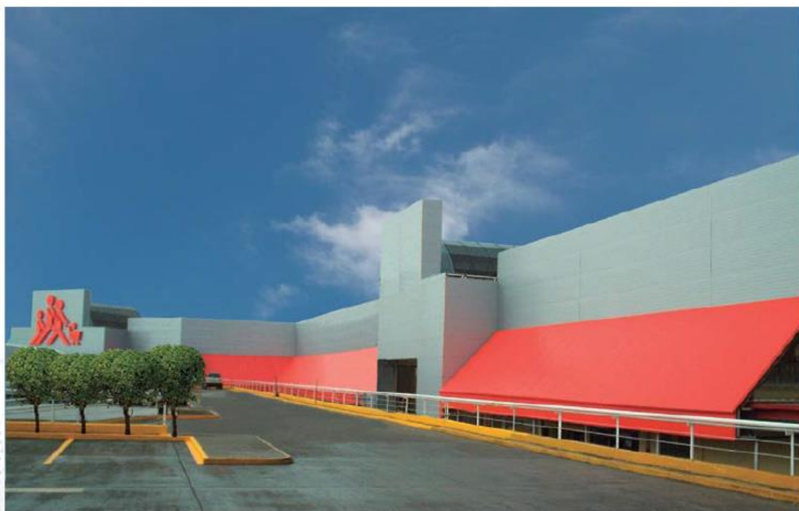
Cumple con la norma: NOM-008-ZOO-1994