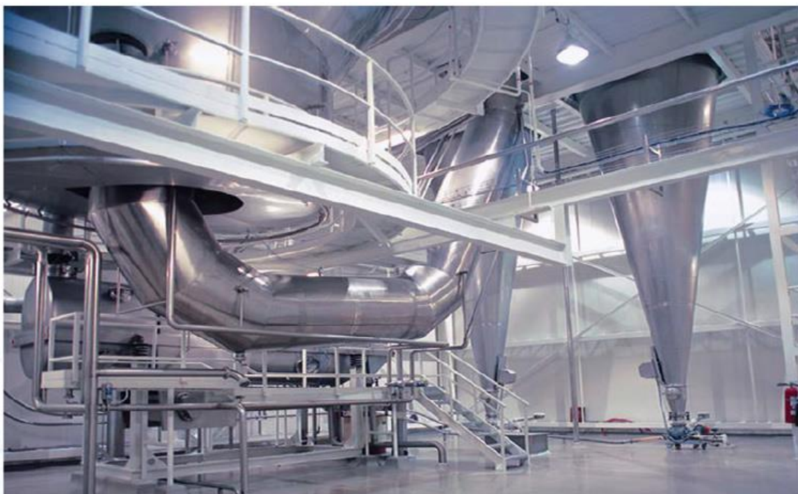
Cumple con la norma: NOM-008-ZOO-1994